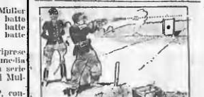
Il tiratore che voleva far centro