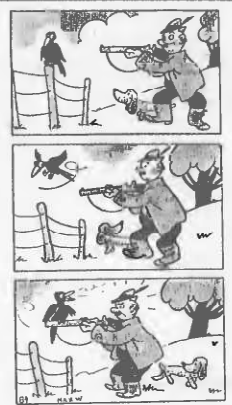
Un rifugio sicuro.

Stampa. I giornali locali — secondo consuetudine dell'A.S.F.A. — hanno già ricevuto l'invito per i posti riservati. I giornali fuori Lugano dovranno rivolgersi direttamente alla Segreteria dell'A.S.F.A. in Berna (Casella postale Transit 506), entro il 10 corr.