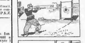
Il tiratore che voleva far centro